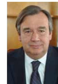
ANTÓNIO GUTERRES, Alto Comisionado de Naciones Unidas para los Refugiados

“Nadie sale ganando en las guerras de hoy, todo el mundo pierde. Los conflictos simplemente continúan, algunos para siempre, otros hasta que terminan en un acuerdo que también podría haberse alcanzado al principio, sin guerra. Es el momento de detener esta violencia sin sentido”.