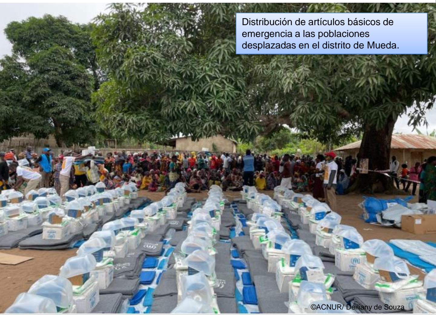
Distribución de artículos básicos de emergencia a las poblaciones desplazadas en el distrito de Mueda.