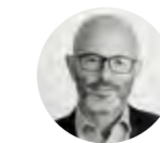
Francesco Sciacca , director general del Comitè espanyol de l'ACNUR