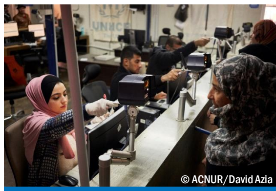
Campo de refugiados en Zaatari, Jordania. Una refugiada siria va a recibir la ayuda económica que proporciona ACNUR. La identificación de cada refugiado se realiza mediante escáner de iris.

Aquí puedes ver algunos ejemplos con costes reales de las ayudas en efectivo para refugio que proporciona ACNUR en algunos contextos a las familias de refugiados y desplazados viviendo en zonas urbanas.